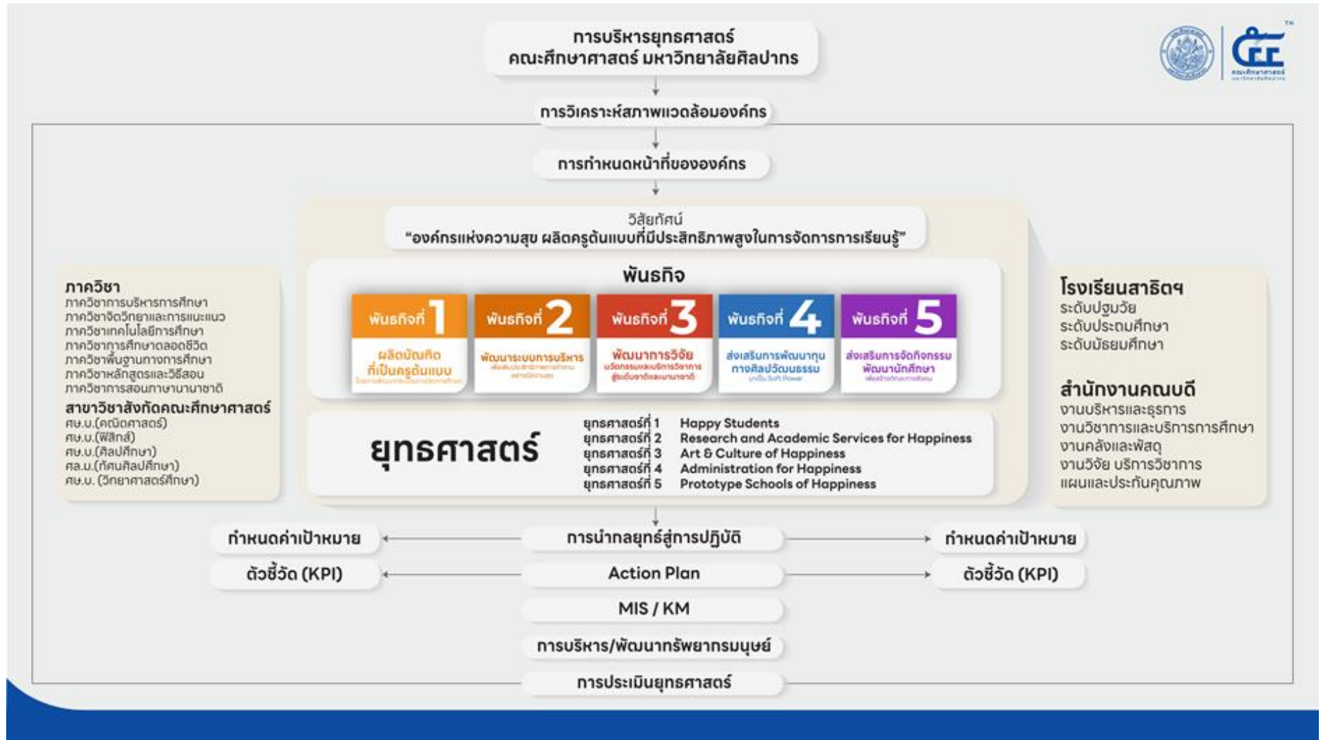
รูปแสดงการบริหารยุทธศาสตร์ คณะศึกษาศาสตร์ มหาวิทยาลัยศิลปากร